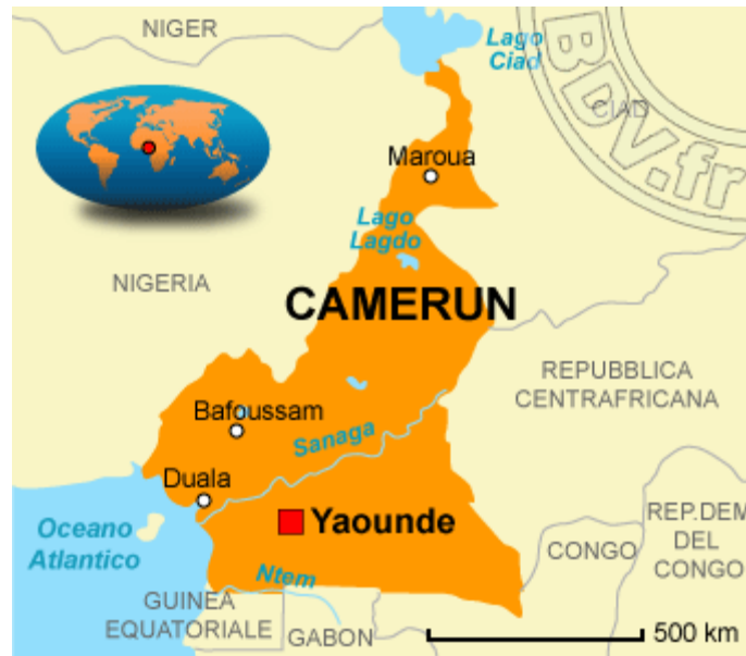
Mappa del Camerun

Titolo: Ristrutturazione e potenziamento di un laboratorio di trasformazione della manioca