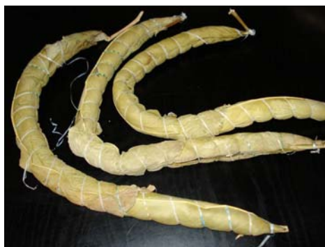
Immagine 2: I bastoni di manioca

Per ottenere i bastoni di manioca (V. immagine 2) bisogna: Sbucciare, lavare e immergere i tuberi per 4 o 5 giorni in acqua. Controllare dopo l'ultimo giorno, quando i tuberi sono morbidi. Scolare e togliere le radici che si trovano all'interno dei tuberi. Premere con decisione con maniglie di piccole dimensioni (palline forma) per estrarre l'acqua, poi hanno una sufficiente quantità di pasta su tutta la lunghezza del foglio ed evitare di legare nodi. Lasciare 2 cm da ogni estremità, tirare i fogli, piega le due parti, legare con uno spago. Fate lo stesso per gli altri, cuocere a vapore per 45 minuti.