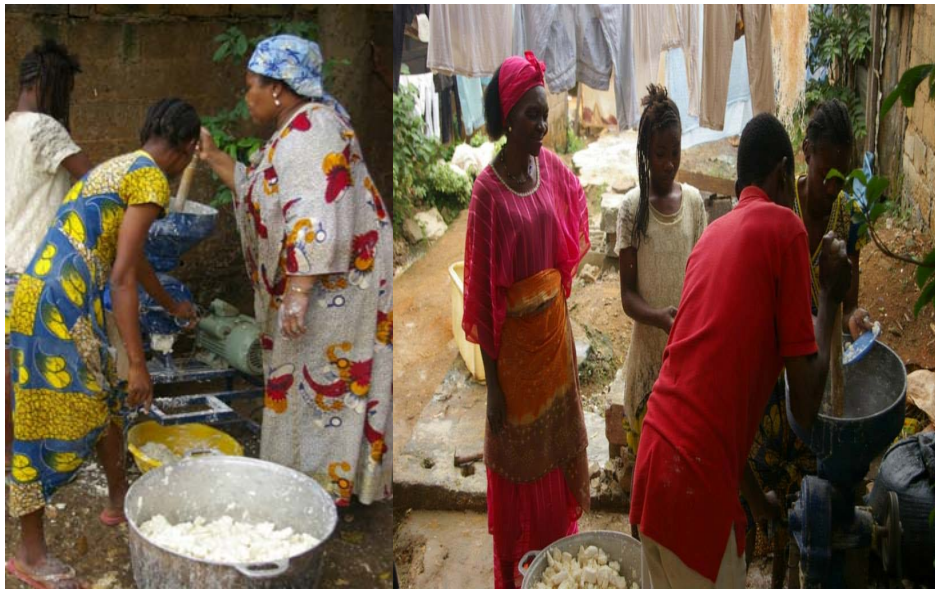
Imagine 3 le ragazze madri stanno macinando la manioca.