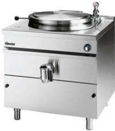
pentola industriale di 150l, circa 4 000 euro