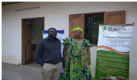
Presidente IT Kola e coordinatrice Fondazione solidarietà...