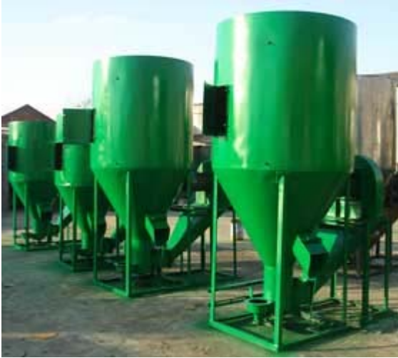
macchine da schiacciare