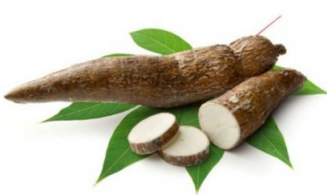
Immagine 1: i tuberi di manioca

Le proprietà della manioca, detta anche “cassava”, sono molteplici; si tratta di una radice dalla forma simile a quella di una carota, la cui scorza è ruvida e marrone, mentre la polpa interna è dura e bianca, ma al contatto con l’aria, per effetto dell’ossidazione, diventa rossiccia. Dalla manioca si ottiene la tapioca, il cuscus, i bastoni di manioca, i mitoumba,etc ( V.figura 1)