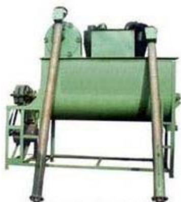
Foto di macchine necessarie